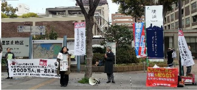
自治労連(県職労組・横浜市従労組)の皆さんも二つの署名奮闘