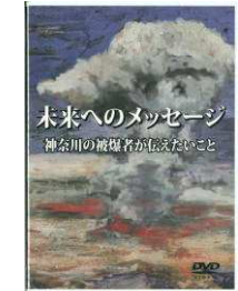
⑤ 被爆を知るために