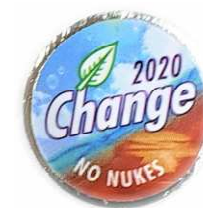
②直径 18 mm